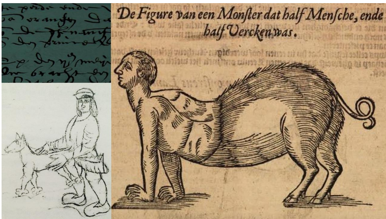
Links: bestialiteit; Rechts: het resultaat van een paring met een varken.

In de middeleeuwen evolueerde sodomie van herenliefde tot een paraplueterm die gebruikt werd om een hele reeks seksuele handelingen aan te duiden. Gemene deler tussen die handelingen was dat ze niet gericht waren op voortplanting, en dus ingingen tegen de goddelijke orde. Hieronder viel zowel ‘heteroseksueel’ anale seks als masturbatie, kindermisbruik en bestialiteit.