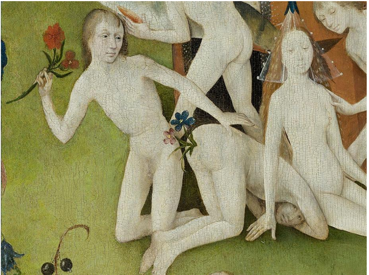
Jheronimus Bosch, De tuin der lusten (ca. 1500-1505) Madrid, Prado.