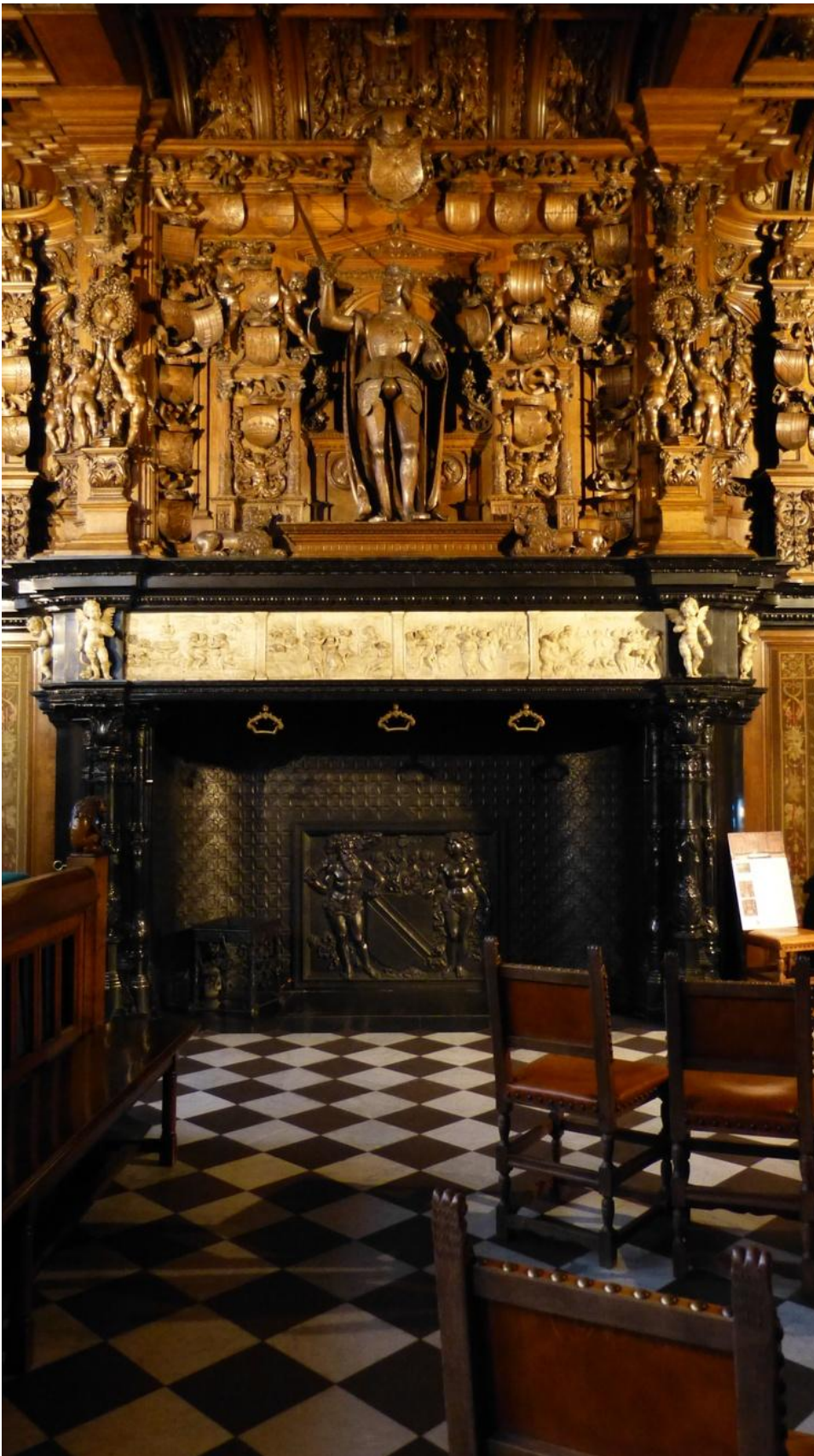
Op 31 mei 2026 leidt ere-archivaris Noël Geirnaert ons rond in de zalen van het Brugse Vrije.